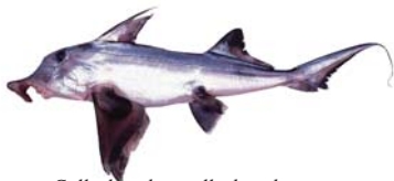
Callorhynchus callorhynchus Pez gallo