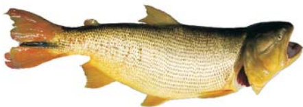
Salminus maxillosus Dorado