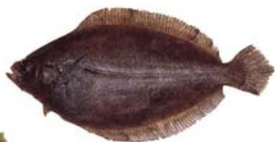
Xystreurys sp Lenguado