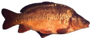
Cyprinus carpio Carpa