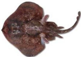
Psammobatis normani Raya