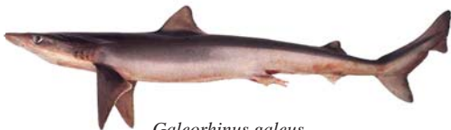
Galeorhinus galeus Cazón