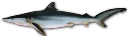
Carcharhinus brachyurus Bacota