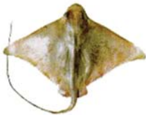
Myliobatis goodei Chucho