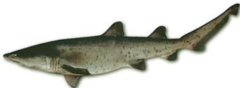
Carcharias taurus Escalandrón