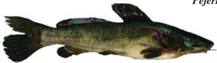
Rhandia quelen Bagre Sapo