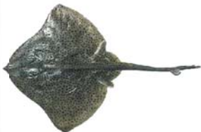
atlantoraja castelnaui Raya a lunares