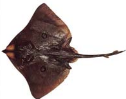
Atlantoraja cyclophora Raya de circulos