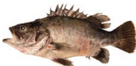
Poliprion americanus Chernia